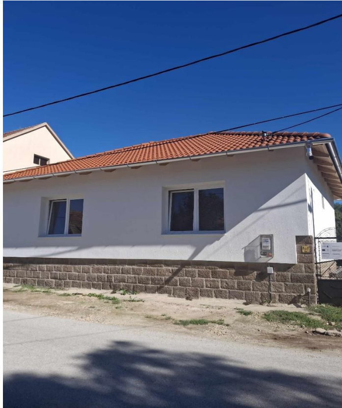
Utcafront és projektábla